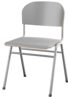
4 ben 44cm