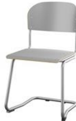
C-understell 45 cm