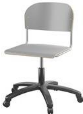
m/gassliff stort sete