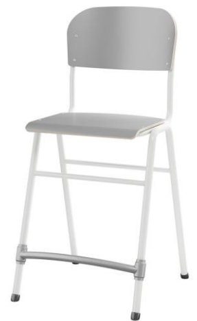
4 ben m/fotstøtte 65 cm