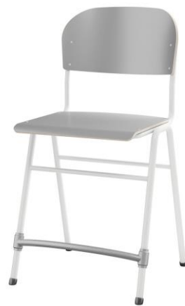
4 ben m/fotstøtte 54 cm