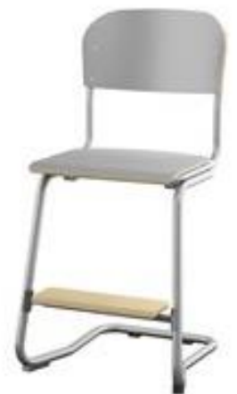
C-understell 57 / 63 cm