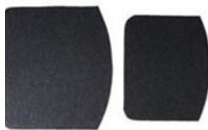
Støydempende filtmatte til stolsete